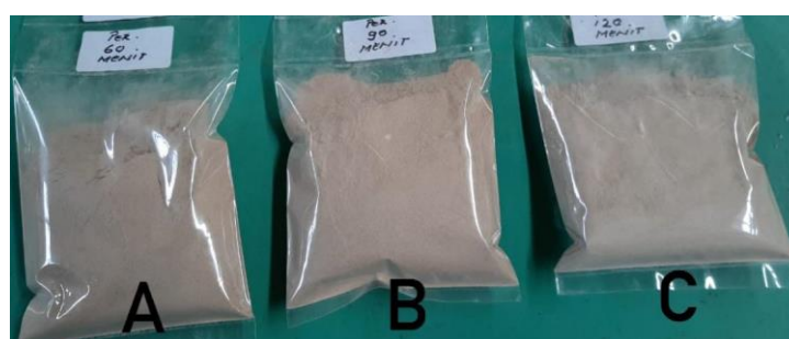
Gambar 2. Tepung Kulit Kentang.

Dalam pembuatan tepung kulit kentang, warna tepung yang dihasilkan berwarna kecoklatan. Browning dapat terjadi pada buah dan sayuran, termasuk kentang, terutama disebabkan oleh oksidasi enzimatis senyawa fenolik tertentu (mono -, di - dan polifenol) menjadi o-difenol. Selanjutnya akan menghasilkan kuinon yang menyebabkan terjadinya polimerisasi non-enzimatis dan terbentuk pigmen warna melanin atau coklat [20]. Untuk memperbaiki warna dari tepung kentang dilakukan perendaman dengan menggunakan larutan Natrium Bisulfit selama 60, 90, dan 120 menit. Natrium bisulfit memiliki kemampuan untuk mencegah reaksi browning pada tepung dengan mencegah aktifitas fenolase [20]. Warna tepung kulit kentang yang dihasilkan dapat dilihat pada Gambar 2.